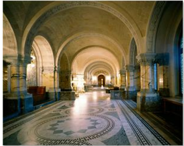
Inside Andrew Carnegie's Peace Palace at The Hague.

دلار برآورد کرد، یا، به عبارت دیگر، تقریباً ۵ برابر ثروت بیل گیتس. موقعی که کارنگی در سال ۱۹۱۹ درگذشت، بیش از نود درصد ثروت خود را بذل و بخشش کرده بود.