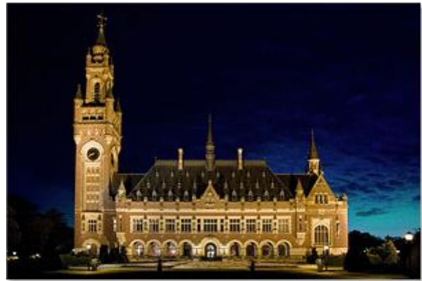
The Peace Palace at night. The palace at The Hague, in the Netherlands, was built by Andrew Carnegie and completed in 1913. It is now the seat of the International Court of Justice, the United Nations' highest legal body.

آنها را به قتل نمی‌رسانیم، اما هنوز مانند وحشیان بی تمدن در جنگ یکدیگر را می‌کشیم. فقط جانوران وحشی برای ارتکاب چنین کاری در این قرن بیستم مسیحی عذرشان پذیرفته است، زیرا جنایت جنگ در آنها ذاتی است، زیرا تعیین کننده حق نیست بلکه همیشه تعیین کننده طرف قوی‌تر است."