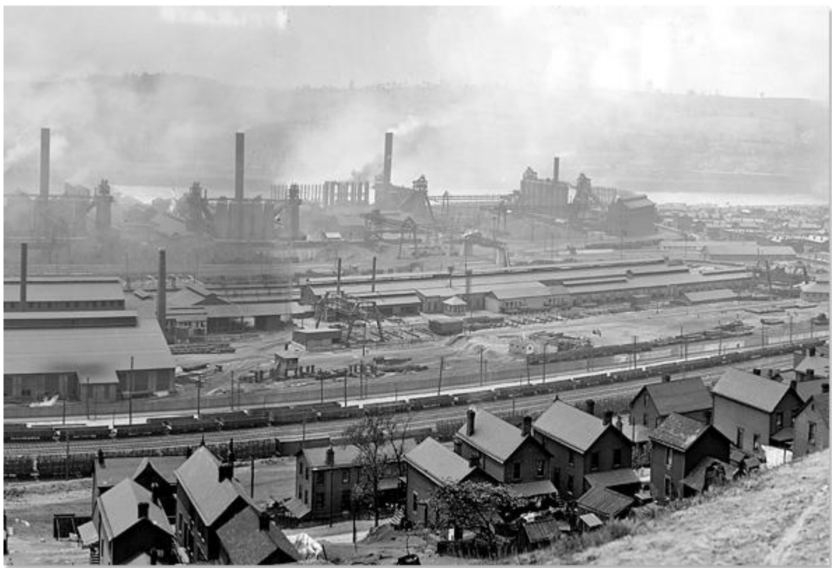
Andrew Carnegie's first steel mill, the Edgar Thomson Works, in North Braddock, Pennsylvania, near Pittsburgh.

کنند، بلکه باید این کار را با درایت انجام دهند و اطمینان حاصل کنند سازمان‌هایی که از آن استفاده می‌کنند تحت نظارت هستند تا پول مزبور هدر نرود. بعداً، او از اعطاء کمک مالی به یک سازمان صلح که یکی از دوستان توصیه کرده بود امتناع کرد، زیرا احساس می‌کرد وجه مزبور بیش از آن که مفید باشد، لطمه وارد می‌کند. او با حیرت نوشت، "تعجب می‌کنم که متوجه این مطلب نیستید. هیچ چیز بیش از پول یک میلیونر از امری شرافتمندانه سلب قدرت نمی‌کند. حیات آن به این وسیله لگه‌دار می‌شود." او مالیات‌های بالایی را که در انگلستان برای املاک برقرار شده بود تصویب کرد. کارنگی نوشت، "با بستن مالیات گزاف به املاک، دولت زندگی بی‌ارزش میلیونر خودخواه را محکوم می‌کند. مطلوب چنان است که ملت‌ها در این جهت بیش از پیش حرکت کنند."